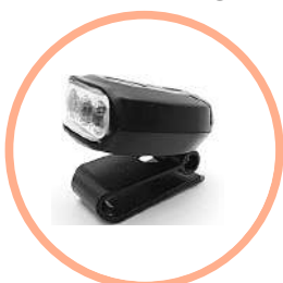
SYSTEME A PILES